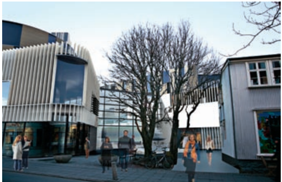
Laugatorg og yfirbyggt Hverfisstræti sem umgjörð mannlífs í miðborginni.