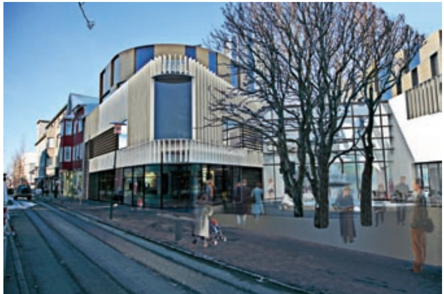
Laugatorg, hluti Laugavegar - mannlíf torgsins hluti upplifunar Laugavegarins.

Það er trú mín að miðbærinn eigi að halda hlutverki sínu og vera miðbær þjóðfélags hvers tíma um leið og hann geymir minningu og sögu okkar. Miðbærinn á að halda hlutverki sínu á öllum tímum og vera aðdráttarafl fjölbreytts mannlífs. Það þarf skipulagslega og pólitíska stefnu til að ákvarða að Laugavegur verði miðstöð verslunar og í raun okkar „aðal“ verslunargata. Gatan þarf að þroskast með