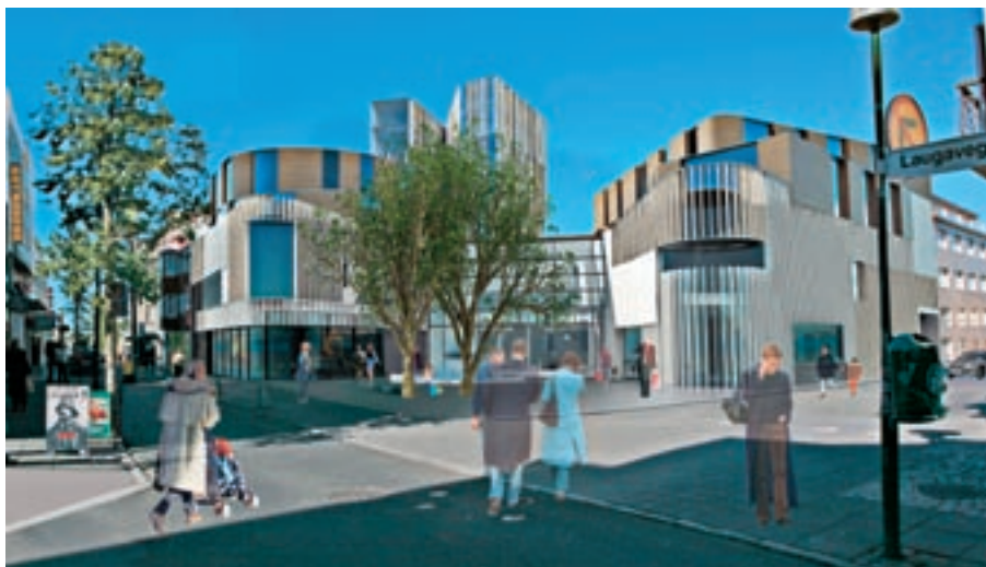
Laugavegur og Laugatorg – mögulegt opið torg við Laugaveg tengist yfirbygððu Hverfisstræti.