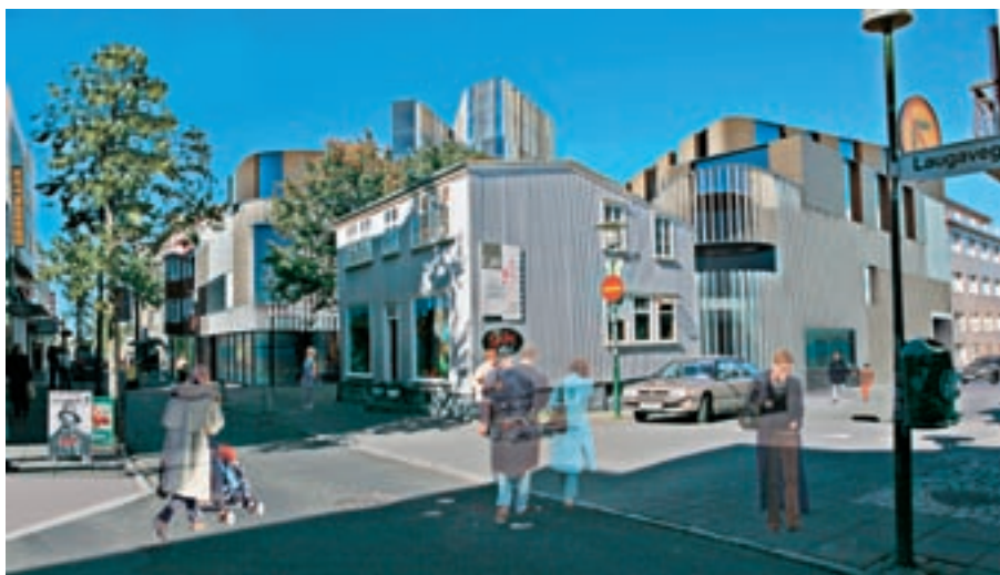
Ásýnd frá Laugavegi – gamalt og nýtt saman, áframhald götunnar og nýting á djúpt reitsins.

Margir snertifletir í tillögum okkar eru að nokkru framsæknir og jafnvel framandi en við teljum þá tóna við möguleika á sviði arkitektúrs og það hvernig menningarsamfélög samtvinna uppbyggingaráform sín nútímanum. Reiturinn er í dag ekki sérstaklega hagvænleg rekstrareining heldur frekar efsti hluti viss „skemmtihverfis“ nátturlífsins. Má gera ráð fyrir að á reitnum hafi einungis verið um 50 starfsstöður og um 30 íbúar. Samtals er gert ráð fyrir í tillögnum að aukning íbúa, búandi gesta og starfa á reitnum yrði um 280 eða í heild allt að 360 einstaklingar, fyrir utan alla viðskiptavini. Við erum í tillögnum ekki að leitast eftir að byggja „afturábak“ en teljum okkur hanna í samhengi. Samhengið er ekki fólgið í því að byggja í sérstökum stíl heldur með virðingu fyrir þeim menningararfi sem felst í mannlífinu, þörfum þess og óskum, því hvernig byggingarnar geta endurspeglað þá menningu og í sátt við þær byggingar og þau rými sem reist voru á öðrum tímum okkar sögu. Við gerum frekar og ekki síður ráð fyrir í tillögum okkar að í þeim endurspegl-ist eðlilegur rekstrargrundvöllur traustra rekstraraðila sem geta með fyrirtækjum sínum hafið ímynd verslunar við Laugaveginn upp í átt að því sem aðal verslunargötur í beinni samkeppni við hann búa við. Samkeppnin er ekki við hliðargötur Laugavegar,