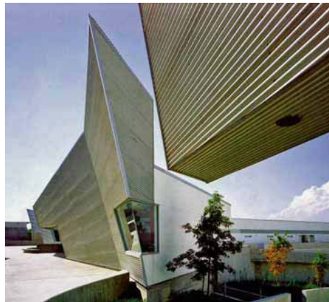
Margir aðilar komu að hönnun Diamond Ranch High School sem var verkefni arkitektastofunnar Morphosis í Los Angeles.